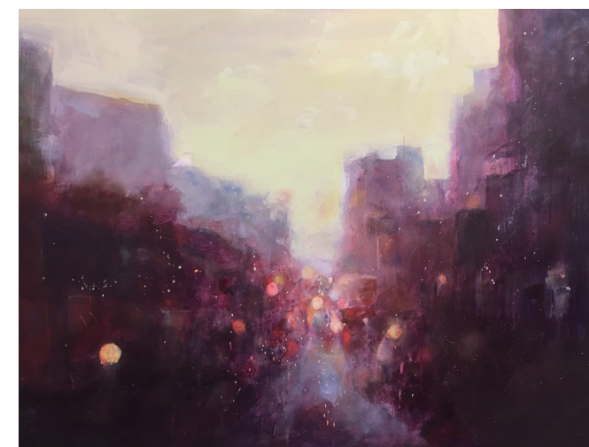
AIR 南山城村 齊藤 真人展 ～還る場所～ Masato Saitou