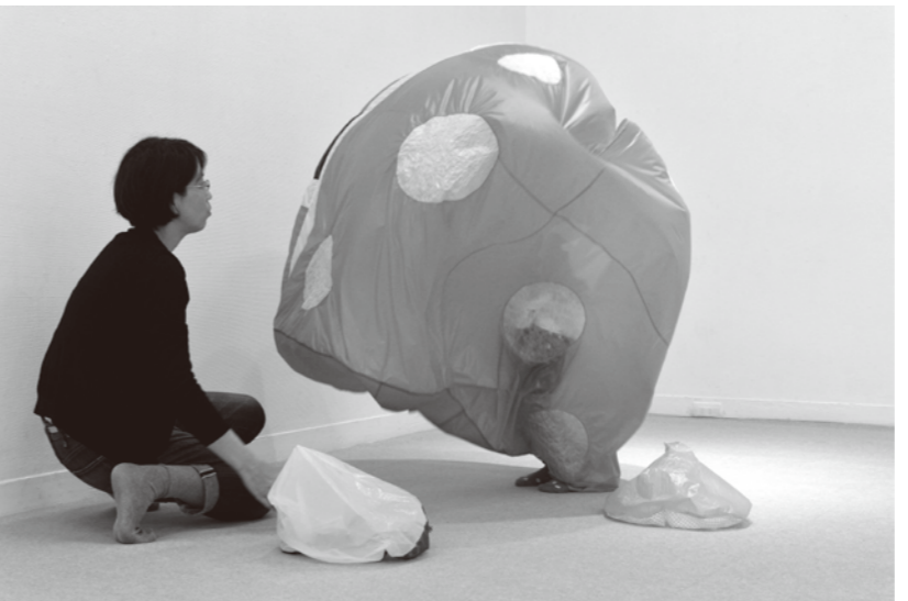
京都芸術センター「てんとう虫プロジェクト「NEW HOME」」展示風景