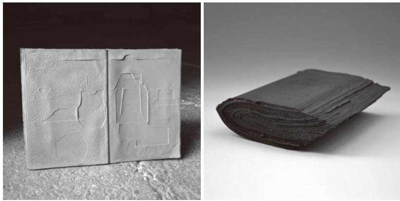
pattern note #1