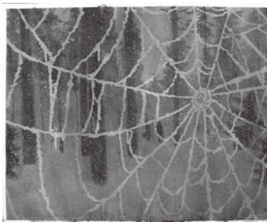
Cobweb / 2013 / acrylic on paper / 487×595 mm