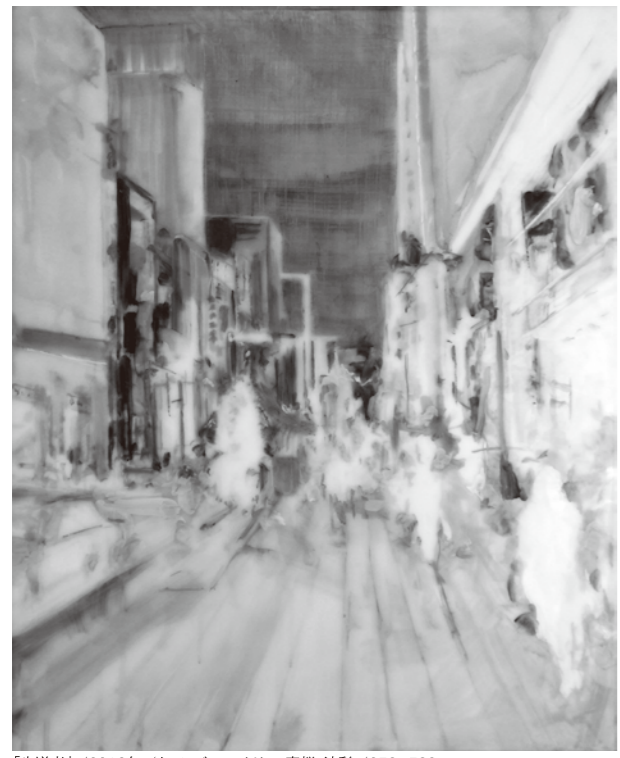
「歩道者」/2013年/キャンバス・アクリル・蜜蝋・油彩/652×530mm

2013.7.14sun~8.11sun Gallery Den mym 本館 12:00~17:00 初日のみ 12:30~ 毎週 水・木曜日は、休廊日とさせていただきます。